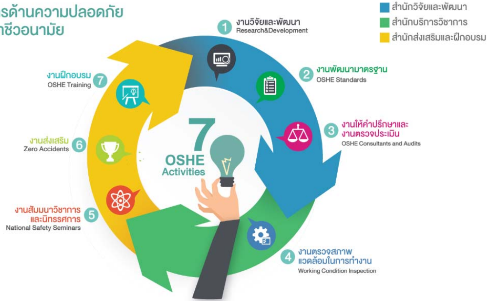
ภาพ แสดงงานสำนักและบริการของ สสปท.